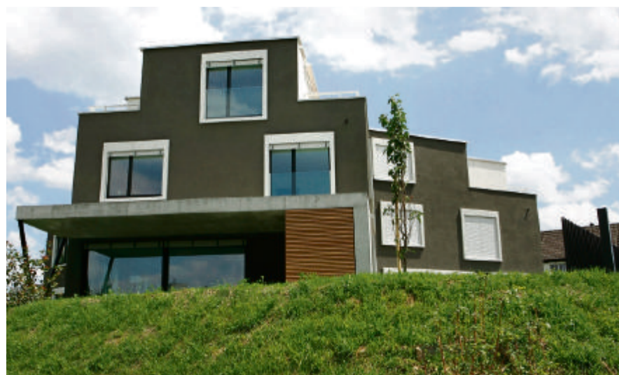
Ein Gebäude, drei Einfamilienhäuser: Die Verdichtung macht's möglich.

Mit der Neuinterpretation des Sternhauses im kleinen Massstab ist den m3-Architekten ein bemerkenswerter Beitrag zum Thema der Verdichtung in Einfamilienhäusern gelungen. Das Gebäude harmoniert auch auf städtebaulicher Ebene gut mit dem Quartier und setzt an einem exponierten Punkt auf dem Moränenhügel einen zurückhaltenden Akzent.